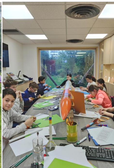
A gauche : Dans le jardin du GAREF, les jeunes testent le bon centrage leur fusée en la faisant tourner avec un fil attaché au centre de gravité de la fusée, si celle-ci reste tangente au cercle qu'elle décrit, alors elle sera stable en vol ; A droite : Au GAREF, les jeunes conçoivent les plans de leur micro-fusée avec SERA 1 comme exemple