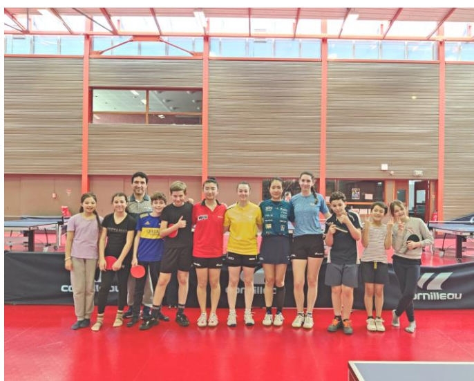
En haut : Les jeunes avec leurs fusées avant le lancement dans le Stade Georges Carpentier