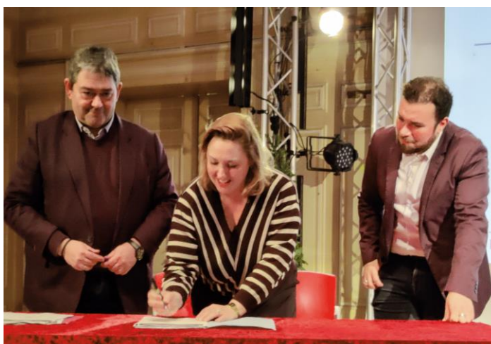
IMG_20221216_204401_GAREF PARIS 2022