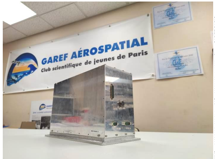
IMG_20230107_202814 et IMG_20230123_140257

Enfin, l'équipe qui gère l'alimentation du satellite assemble les blocs spécifiques d'alimentation, un travail nécessitant une extrême rigueur lors des tests et sélection de chaque pile.