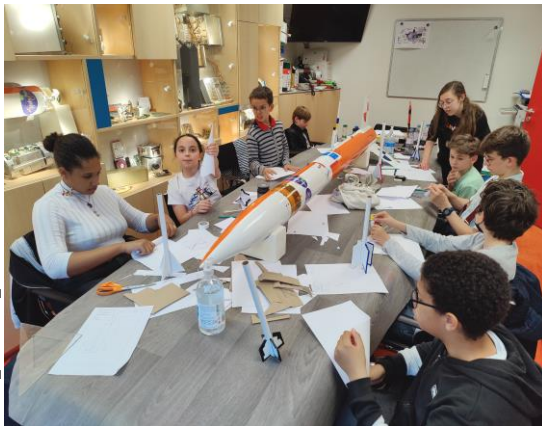
Construction des coiffes de micro-fusées, la tâche est complexe mais pas de quoi décourager les jeunes.

Notons à ce sujet, que les stages 8-15 ans réussissent à avoir une quasi-parité en encourageant les filles comme les garçons à investir les secteurs scientifique et technique.