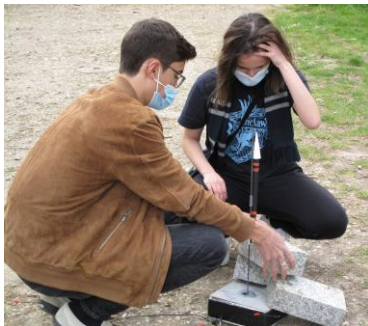
IMG_8252 - & IMG_8251