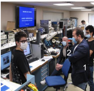
IMG_8281 & IMG-20210509-WA0002