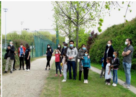
Photo du lancement des micro-fusées, dans le centre sportif Georges Carpentier, auquel les parents ont pu assister. A droite, du stage d'électronique et soudure dans la salle de réunion du GAREF.