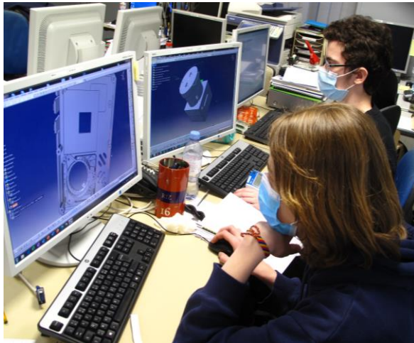
IMG – 5767