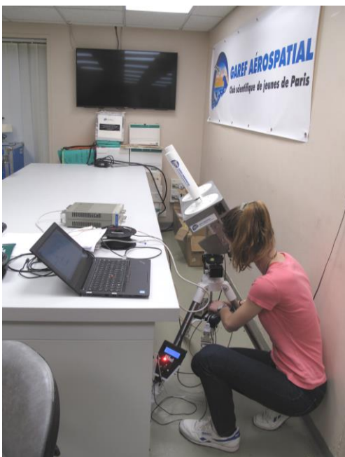
IMG – 130

Dans le labo, mise au point de l'électronique embarquée complexe, qui sera chargée de contrôler les caméras lors du vol de HORUS 11.