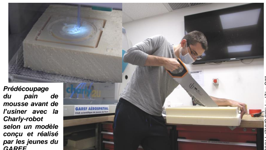
IMG – 127 – Photo GAREF PARIS

Test de l'antenne au sol qui est chargée de réceptionner les données transmises en télémétrie à 1Mbit/sec (PCM/FM en bande S, 2200-2300 MHz).