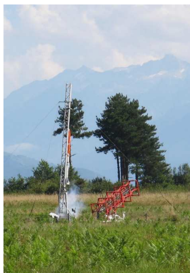
G15 – 6234 – 6237 – 6240

Au total, 16 fusées expérimentales auront été lancées sur le C'SPACE 2015 dont la fusée russe biétage TSR1 du club AIST de l'université de Samara et la Fusex japonaise du club TKRC (Team Kansai Rocket Club), d'Osaka avec largage d'un drone autogyre.