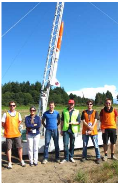
G15 – 6226

Parmi les fusées expérimentales PERSEUS lancées lors de la campagne, la fusée HYDRA est une fusée bi-étage réalisée par le Supaero Space Section ( S 3 ), en coopération avec Centrale Lyon Cosmos ( CLC ), l' IPSA et le GAREF .