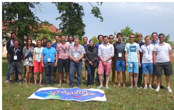
G15 – 9744 Photos GAREF PARIS

Le C'Space 2015 s'est déroulée avec succès du 18 au 25 juillet 2015 . Cette 52ème édition du rassemblement Espace - Etudiants s'est tenue près de Tarbes, au Camp de Ger , site d'entraînement du premier régiment de hussards parachutistes.