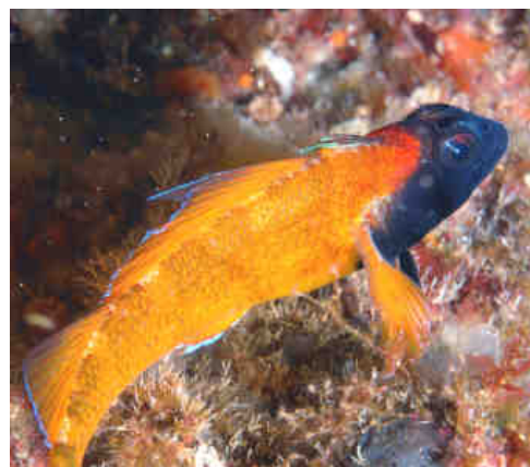
G07L033 - G07L069