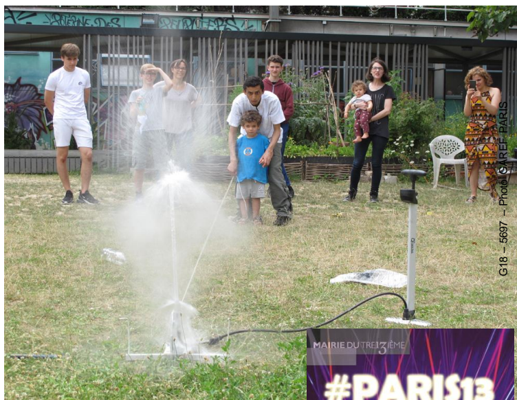
G18 - 5697

Après le report au printemps 2019 de la campagne SERA 4 à Kiruna, le club se prépare pour la campagne nationale de lancements qui aura lieu au Camp de Ger , près de Tarbes, du 14 au 21 juillet 2018 et durant laquelle le GAREF va renouer avec le lancement de ballon sonde.