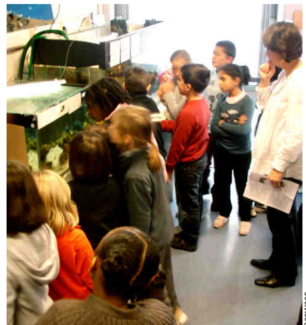
Ci-dessus : une classe de CE1 classe dans le laboratoire du GAREF OCEANOGRAPHIQUE pour répondre à des questions sur la biodiversité marine grâce au aquarium du centre.