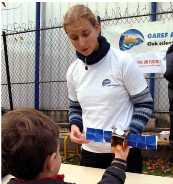
Ci-dessus : un jeune montre fièrement sa maquette de satellite réalisée au GAREF à l'occasion de la fête de la Science. Les enfants sont repartis avec leur réalisation et plein de connaissances sur les énergies renouvelables.