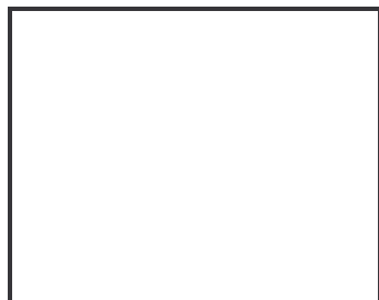
Schéma simple du site